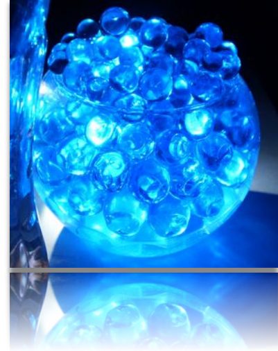
Sepa - @BySepa / @BySepaTW